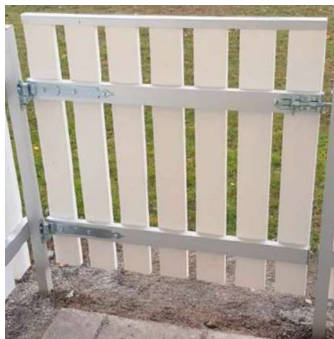
BILD 5 - VIT STAKETSGRIND

På vår hemsida hittar ni allmänna råd och skötselranvisningar.