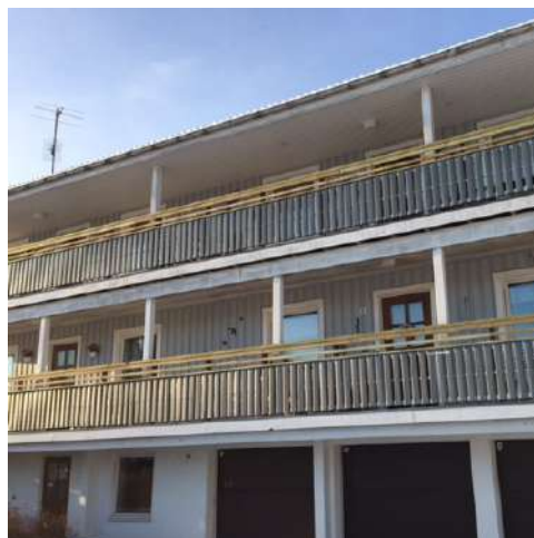
BILD 6 - GRÅ LOFTGÅNG PÅ BEFINTLIGA STOLPAR