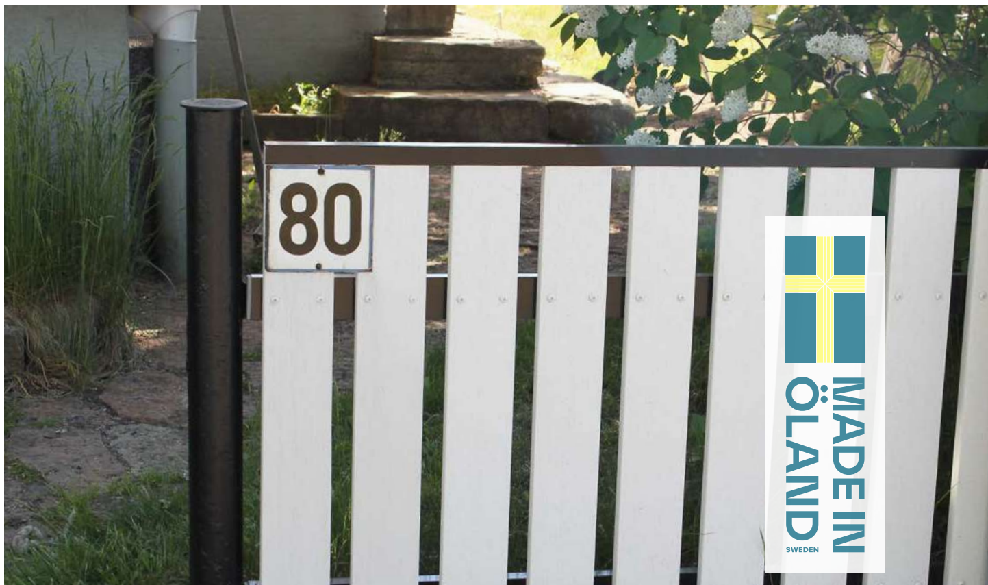
BILD 1 - VIT ÖLAND MED SVART LACK

PolyPlank AB erbjuder underhållsfria och CE-märkta bullerplank för väg, järnväg och bro till företag och privatpersoner. PolyPlanken består av återvunnen plast och kutterspån. Det ger profilerna en estetisk träyta som smälter in snyggt i stad och landsbyggd. Våra profiler tillverkas i vår fabrik på Öland.