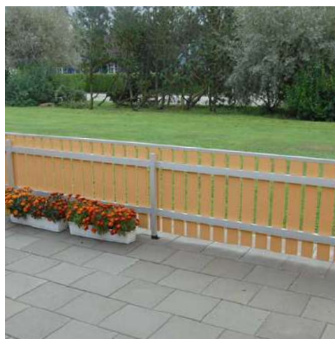
BILD 7 - GULT STAKET