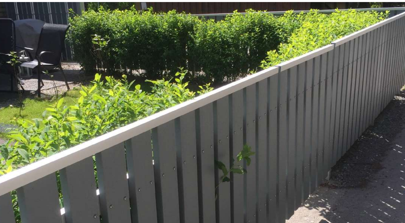
BILD 2 - GRÅTT STAKET MED GRIND