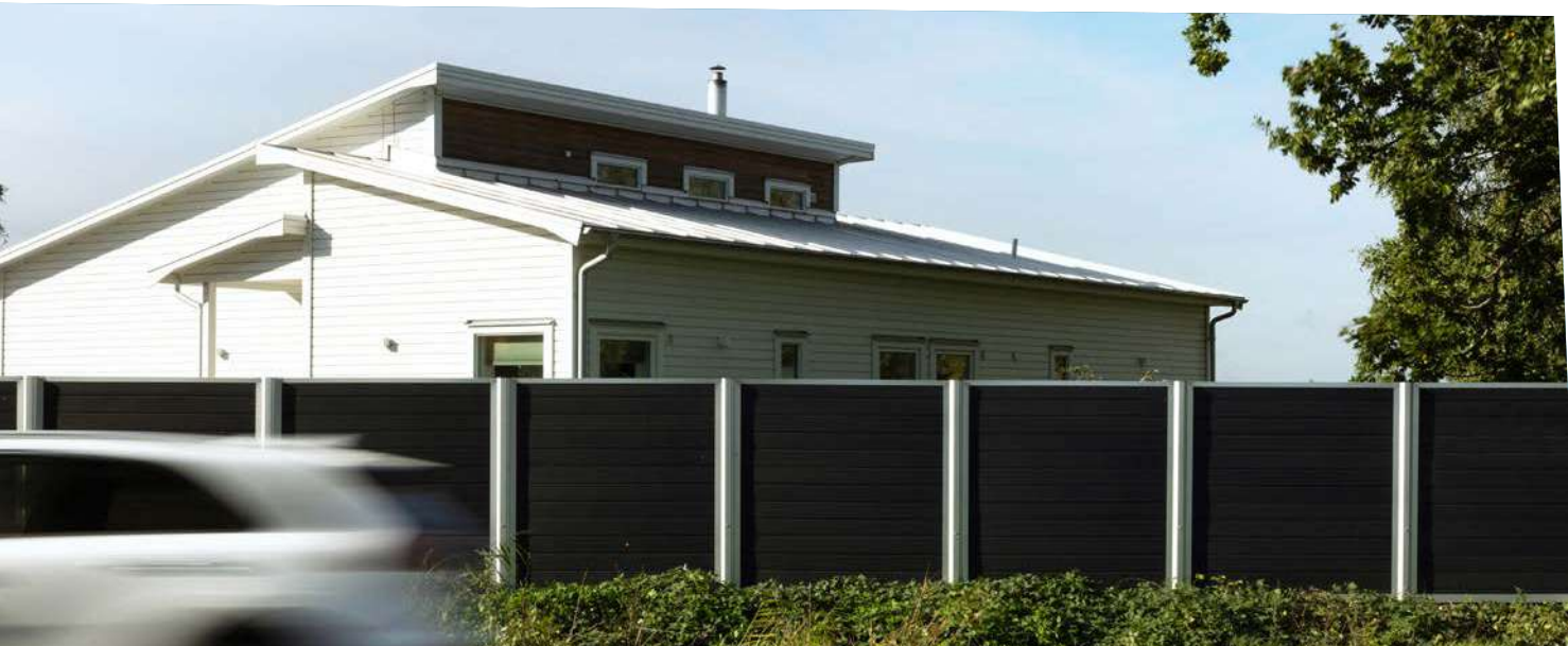
BILD 5 - SVART EKERUM MED LIGGANDE PLANK