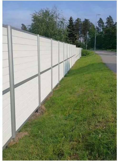
BILD 3 - VIT EKERUM MED LIGGANDE PLANK

Vi har sex stycken standardfärger men kan få fram plank och aluminium i valfri kulör som tillägg.