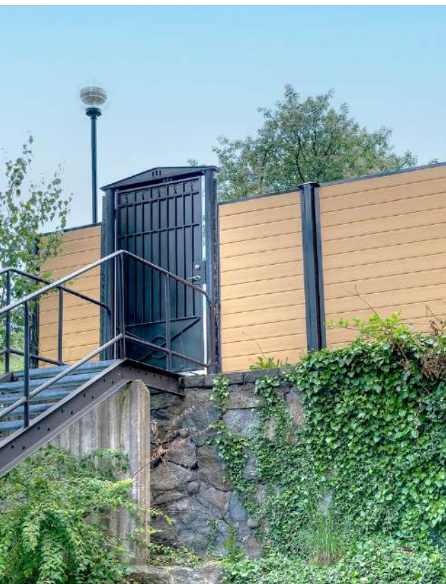
BILD 4 - GUL EKERUM MED LACKERADE STOLPAR