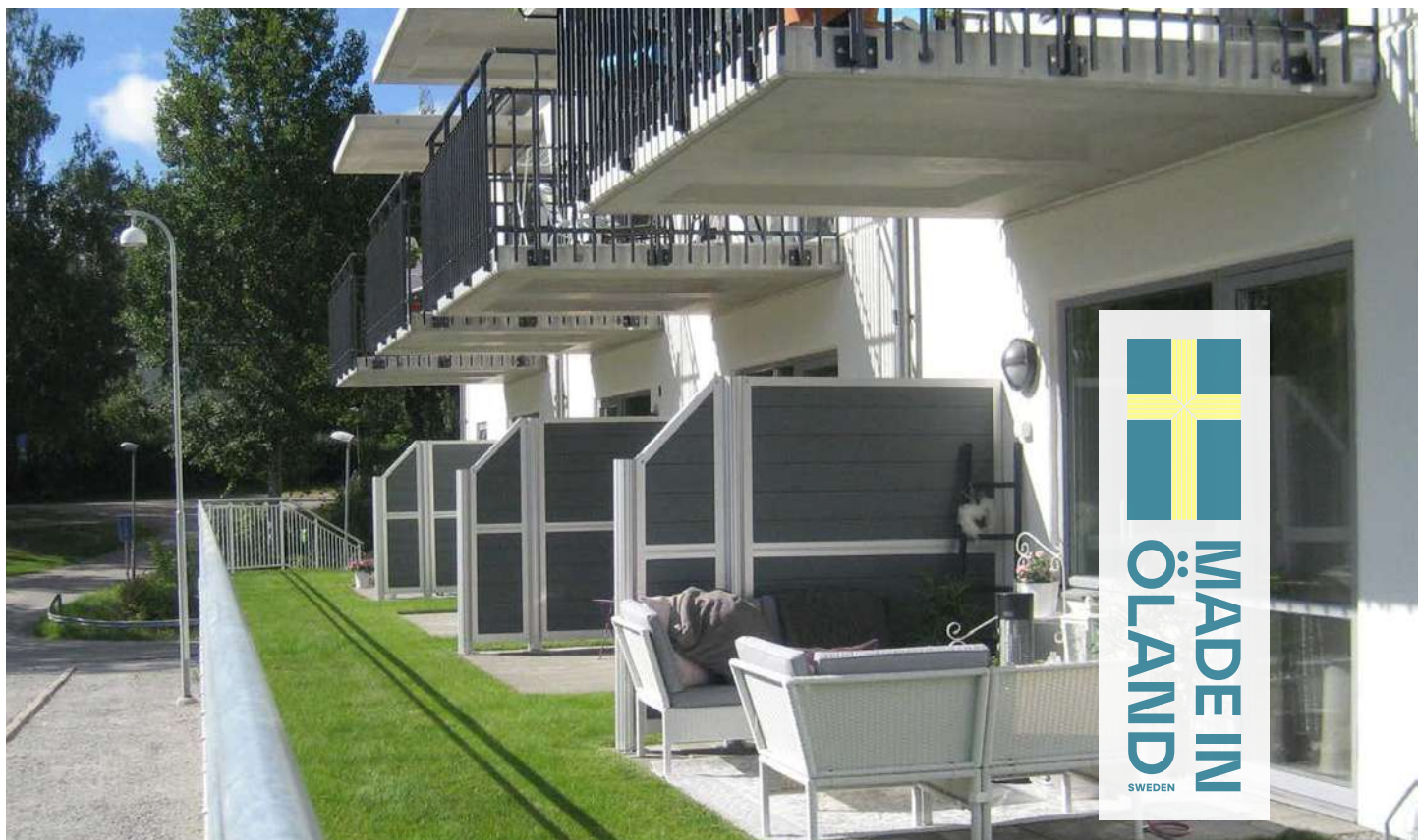
BILD 1 - GRÅ EKERUM MED LIGGANDE PLANK

PolyPlank AB erbjuder underhållsfria och CE-märkta plank för väg, järnväg och bro till företag och privatpersoner. PolyPlanken består av återvunnen plast och kutterspån. Det ger profilerna en estetisk träyta som smälter in snyggt i stad och landsbyggd. Våra profiler tillverkas i vår fabrik på Öland.